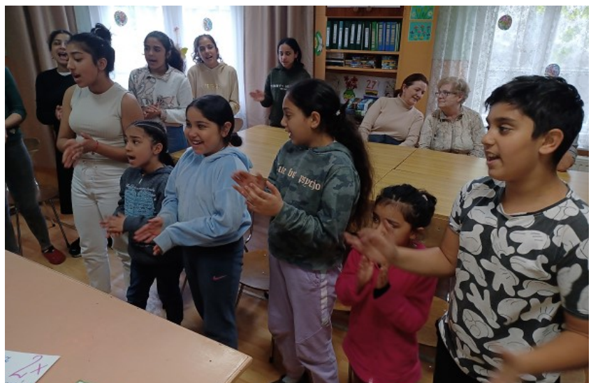
Abb. 8 Singende Kinder in Zabrze

weil viele Eltern Analphabeten sind. Auch die Gruppe der Älteren erhält Hilfe bei den Hausaufgaben, engagiert sich andererseits auch bei der Betreuung der Kleinen. Zentrales Element ist das gemeinsame Kuchenessen vor dem Lernen, für so manchen der Hauptgrund für die Anwesenheit, weil