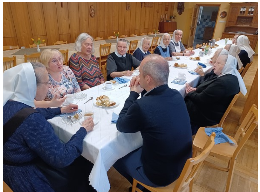
Abb. 7 Mittagessen mit den Diakonissen

Nicht alle Zimmer verfügen über ein eigenes Duschbad. Der Staat trägt bei den konfessionellen Häusern einen geringeren Anteil der Pflegekosten als bei den Heimen der Ortsgemeinde. Der Bischof erläuterte uns die finanzielle Situation in der Pflege und wie schwer es ist, die Bausubstanz zu erhalten, denn die zugewiesenen Pflegekosten