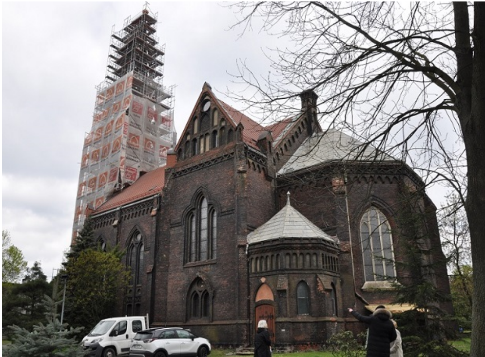
Abb. 1 Kirche in Schwientochlowitz

Stadt Reichtum bescherte und es eine große evangelische Gemeinde gab. Heute betreut der Pfarrer zwei Gemeinden mit jeweils etwa 150 ev. Christen. Kirche und Pfarrhaus stehen unter Denkmalschutz. Die Kirche wird derzeit aufwändig restauriert. Die Mittel dazu stammen aus Spenden der Gemeinde (Privatpersonen und Institutionen) aber der überwiegende Teil stammt aus dem Denkmalschutz. Den Kirchenraum schließt eine Holzdecke ab mit einer Pflanzen und Blumen darstellenden Bemalung. Pfr. O. ist am Ort bei der Feuerwehr aktiv und plant nach Ende der Renovierung eine mehrere Tage dauernde Übung zur Brandbekämpfung.