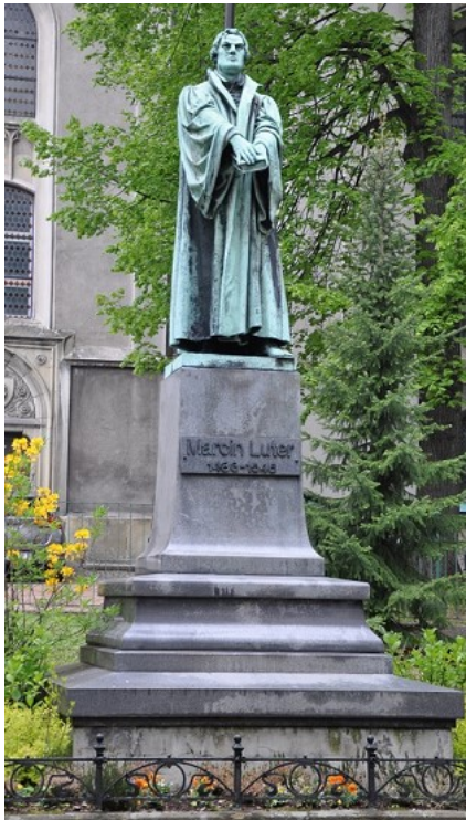
Abb. 6 Lutherdenkmal in Bielsko-Biała

Engagement um Straßenkinder kümmern und diesen gute Perspektiven bieten. An diese Stiftung senden wir auch Kindersachen von den Kleiderbasaren. .