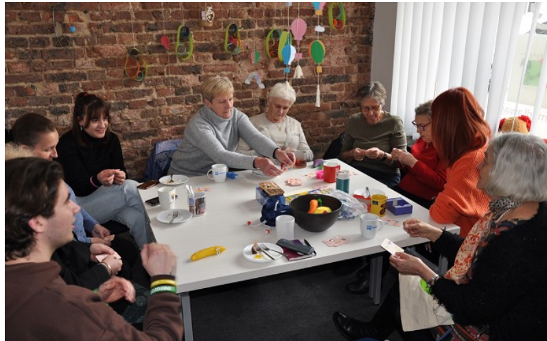
Abb. 5 Seniorenkaffee bei der Jest for Was- Stiftung

An zwei Tagen besuchten wir unterschiedliche Aktivitäten bei der Jest for Was-Stiftung (vormals Sonnenland). Die Stiftung musste sich im vergangenen Jahr andere Räumlichkeiten suchen, weil Bischof Niemiec die bisherigen Räumlichkeiten anders nutzen möchte.